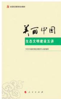
《全国党员教育培训教材：美丽中国——生态文明建设》