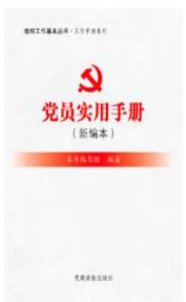
《组织工作基本丛书·工作手册系列：党员实用手册（新编本）》