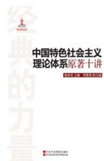
《中国特色社会主义理论体系原著十讲》