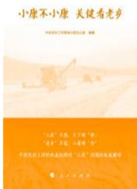
《小康不小康 关键看 老乡》