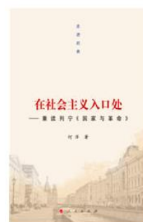
《走进经典丛书：在社会主义入口处》