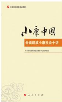
《全国党员教育培训教材：小康中国——全面建成小康社会十讲》