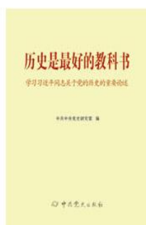
《历史是最好的教科书——学习习近平总书记系列重要讲话的重要论述》