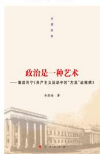
《走进经典丛书：政治是一种艺术》