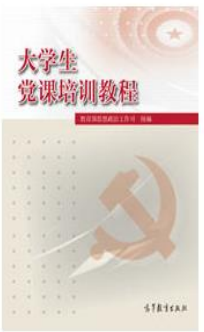
《大学生党课培训教程》