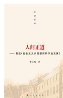
《走进经典丛书：人间正道》