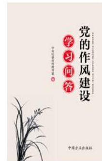
《党的作风建设学习问答》