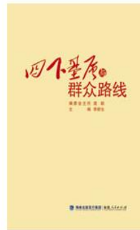
《四下基层与群众路线》