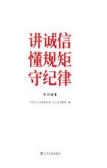
《讲诚信 懂规矩 守纪律学习读本》