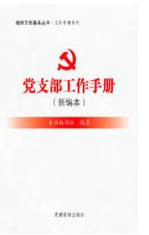
《组织工作基本丛书·工作手册系列：党支部工作手册（新编本）》