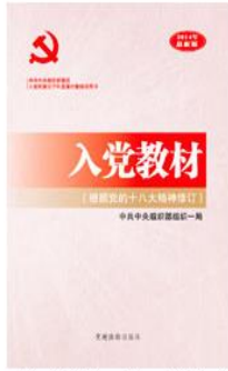
《入党教材（根据党的十八大精神修订）》