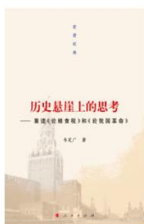
《走进经典丛书：历史悬崖上的思考》