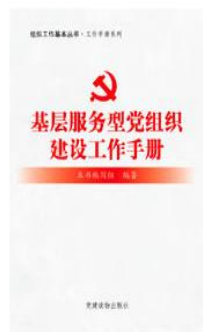
《组织工作基本丛书·工作手册系列：基层服务型党组织建设工作手册》