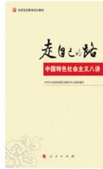
《全国党员教育培训教材：走自己的路——中国特色社会主义八讲》