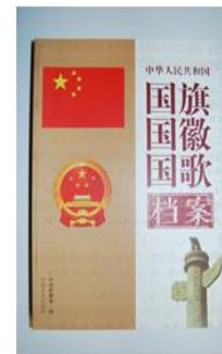
《中华人民共和国国旗国歌 档案》（上、下卷）