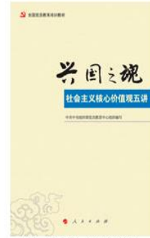
《全国党员教育培训教材：兴国之魂——社会主义核心价值观五讲》