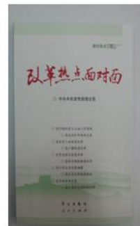
《改革热点面对面：理论热 点面对面·2014》