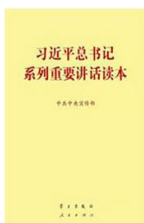
《习近平总书记系列重要讲话读本》