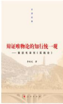
《走进经典丛书：辩证唯物论的知行统一观》