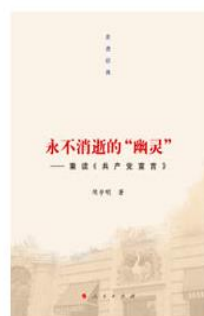
《走进经典丛书：永不消逝的“幽灵”》