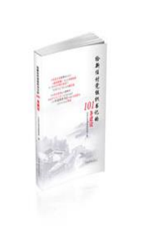
《给新任村党组织书记的101条建议》